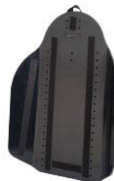
Armazón de Respaldo alto