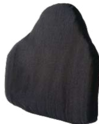
Sistema de Respaldo Estándar Pro-tech®