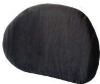
Sistema de Respaldo Excel