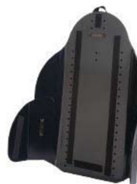
Armazón de Respaldo alto de perfil profundo