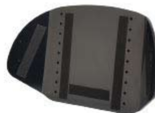
Armazón del Respaldo