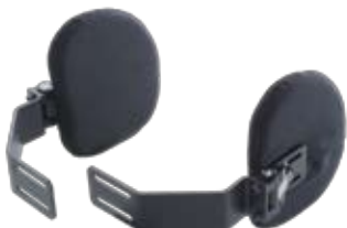
Soporte Lateral Giratorio QuickPlus

Para soportes laterales adicionales, utilice las Almohadillas Laterales Pro-tech® con cualquiera de los Soportes Laterales Fijos Pro-tech o Soporte Lateral Giratorio QuickPlus Pro-tech