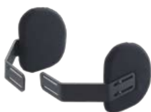
Soporte Lateral Fijo Pro-tech

Utilice la Placa Adaptadora Pro-tech® (Pieza N°. 83306) para sujetar su opción de Soporte de Reposacabezas y Almohadilla Reposacabezas POSAlinc para su Sistema de Respaldo Pro-tech