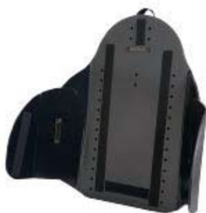
Armazón de Respaldo de perfil profundo

Soporte de perfil profundo que permite sujetar fácilmente los paneles para mejorar la estabilidad del tronco, ofreciendo profundidad y anchura ajustables