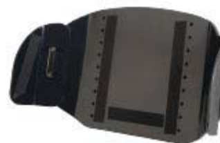
Armazón del Respaldo de perfil profundo