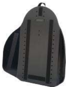
Armazón de Respaldo Estándar