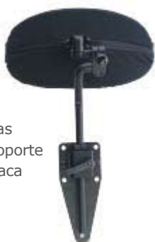
Reposacabezas blando con Soporte POSAlinc y Placa Adaptadora Pro-tech