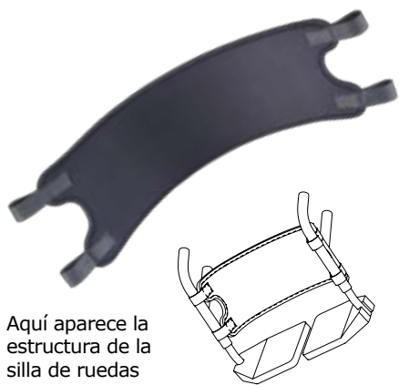
Aquí aparece la estructura de la silla de ruedas